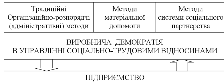
Рис. 2. Модель виробничої демократії в умовах трансформації економіки України.

Сутністю процесу виробничої демократії є цілеспрямований вплив на управління взаємодією суб'єктів СТВ для досягнення поставленої мети. Не-